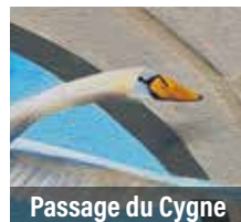
Passage du Cygne